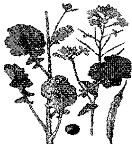
Однолетняя масличная культура семейства крестоцветных

27. Многолетнее кормовое растение семейства бобовых, обладающее молокогонным действием это